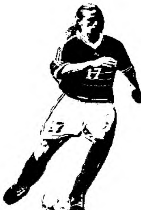
б) внутренней частью подъема