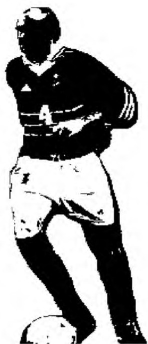
в) средней частью подъема