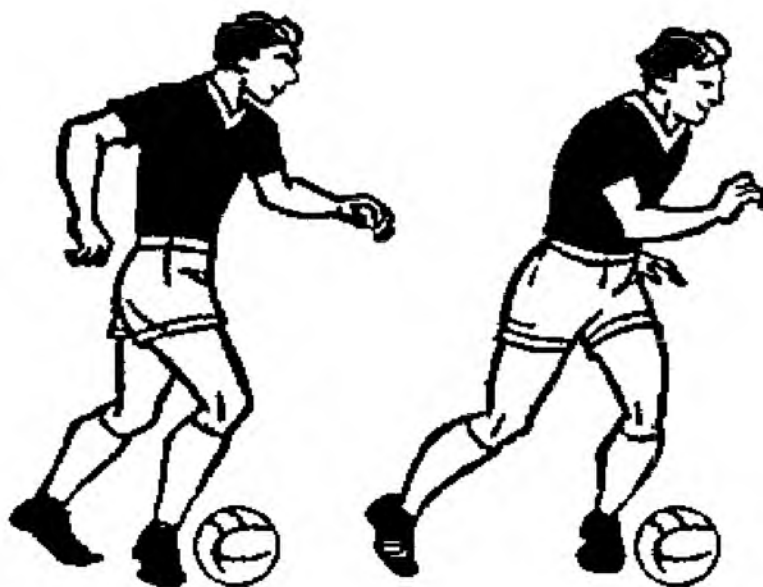
а) внешней частью подъема

Техника выполнения ведения мяча различными способами: